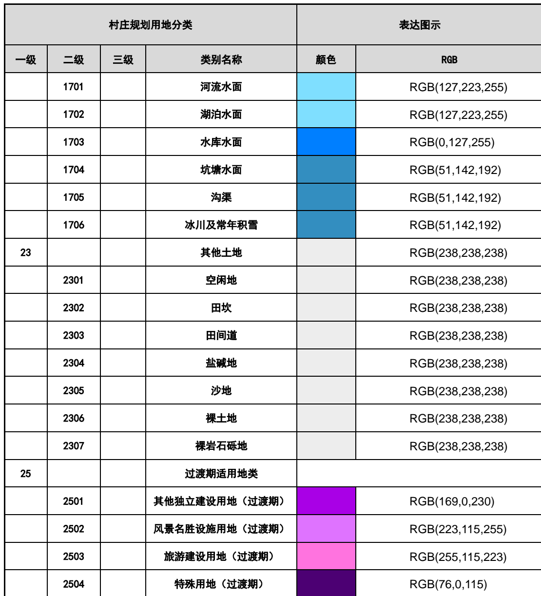
表 A-2 其他要素配色指引表