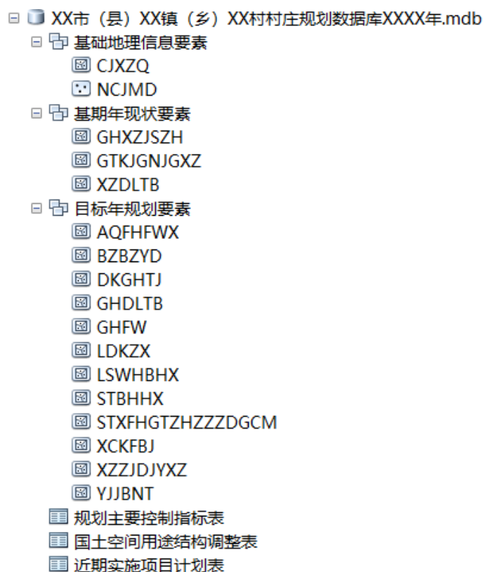
图 3-1 海南省村庄规划矢量数据库成果数据汇交目录示例图