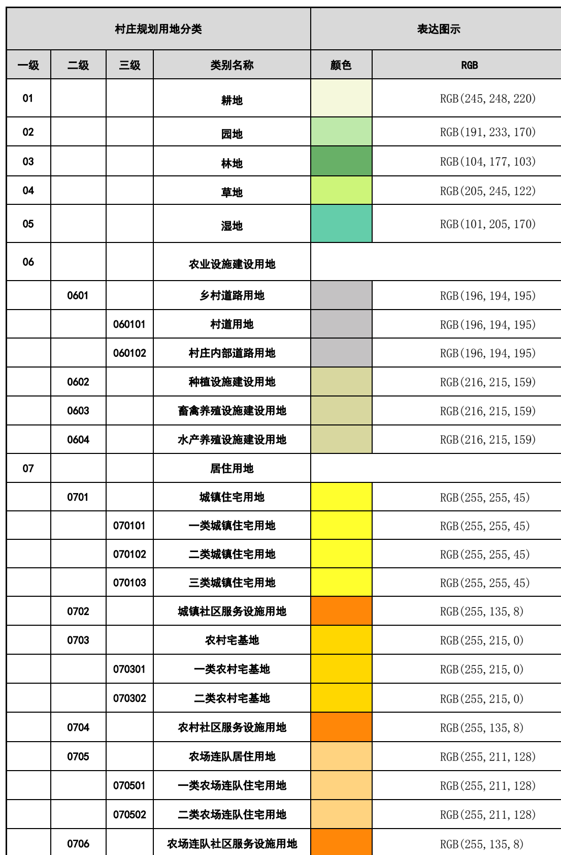
表 A-1 用地分类配色指引表